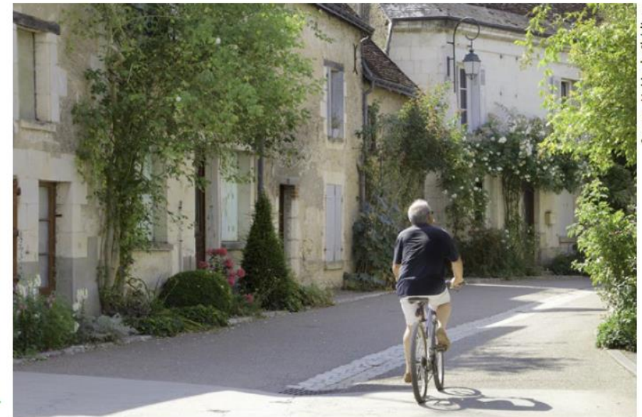
Rue du Lavoir « Après » ►