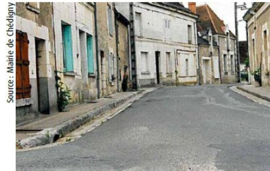
▲ Rue du Lavoir « Avant »

Quelques photos Avant/Après aménagement qui permettent de visualiser les transformations