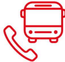
TRANSPORT À LA DEMANDE